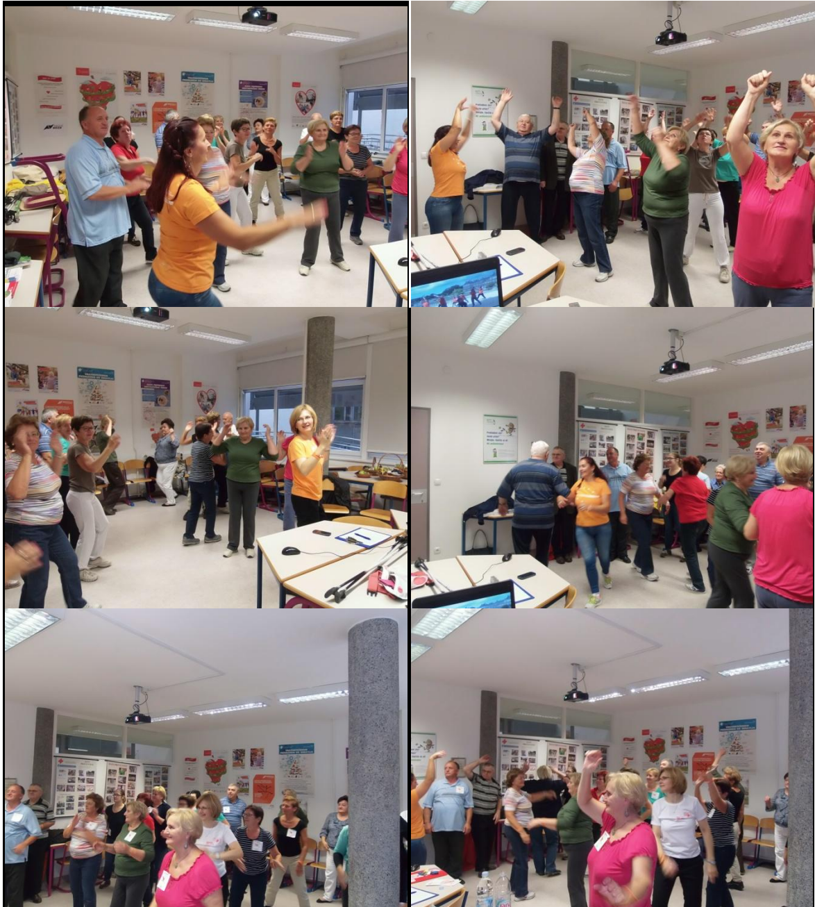
Članovi Grupe za podršku na plesnoj radionici, Dan otvorenih vrata u ZZIZ Međimurske županije

Grupa podrške u Savjetovalištu za prevenciju prekomjerne tjelesne težine i debljine našeg Zavoda oformljena je u 5. mjesecu 2013. godine kao nadopuna individualnom savjetovanju. Riječ je o osobama sa specifičnim potrebama, što definira specifičan način rada grupe i sadržaje koji se prorađuju. Dominantno se postupci odnose na razmjenu informacija i savjete s ciljem poticanja zdravog stila života usmjerenog prvenstveno prema kontroli tjelesne težine, ali i zdravlja općenito. Budući smo od 21.-27.09. u našem zavodu i cijelom Međimurju obilježavali Tjedan promicanja tjelesne aktivnosti, odabrali smo za temu grupe za podršku plesnu radionicu te smo bili jako ugodno iznenađeni pozitivnim reakcijama svih sudionika. Zaključili smo da bi trebali češće organizirati takve radionice.